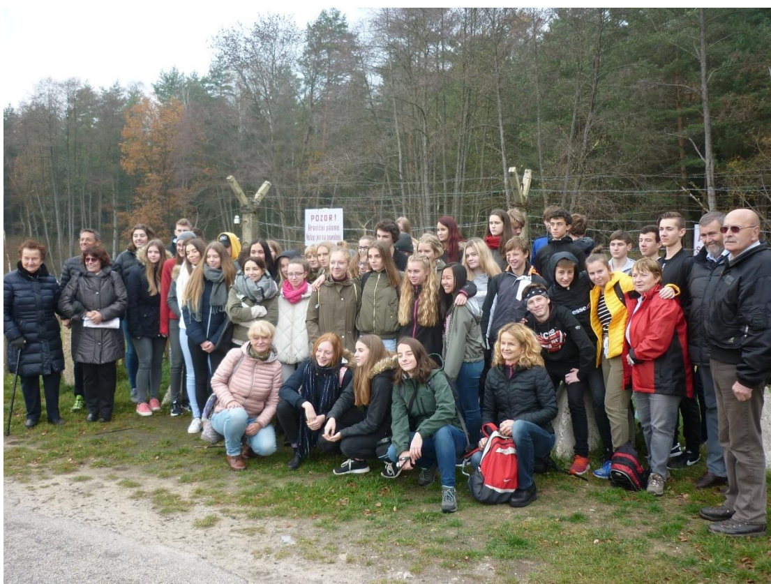
Česko-rakouský dějepisný projekt „Za železnou oponou“