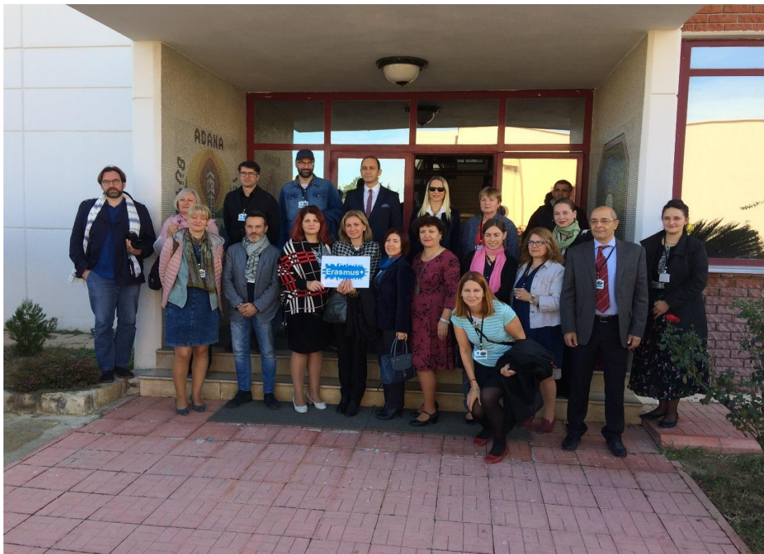
Setkání pedagogů v turecké Adaně v rámci programu Erasmus+ (listopad 2018)