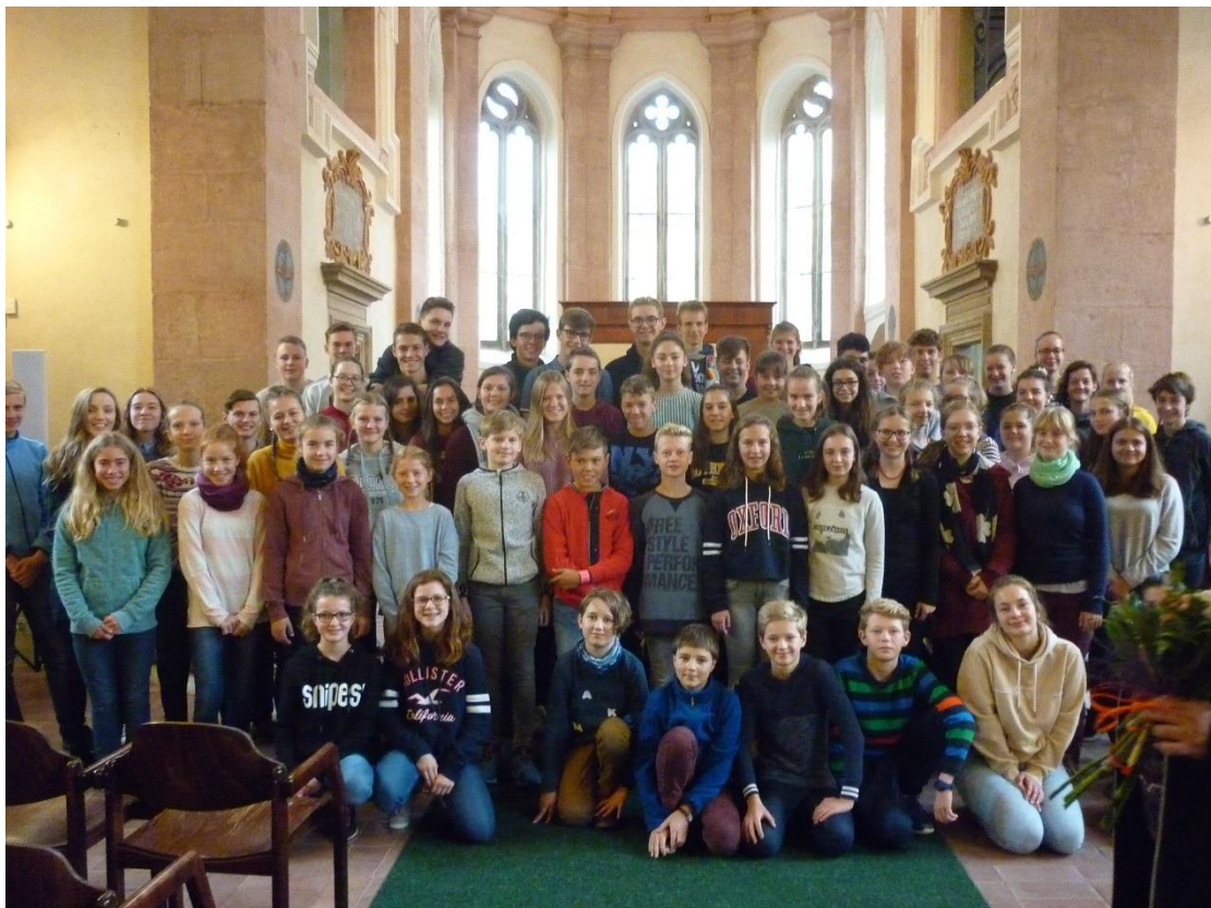
Společné foto účastníků výměnného pobytu s gymnáziem z Neckargemündu