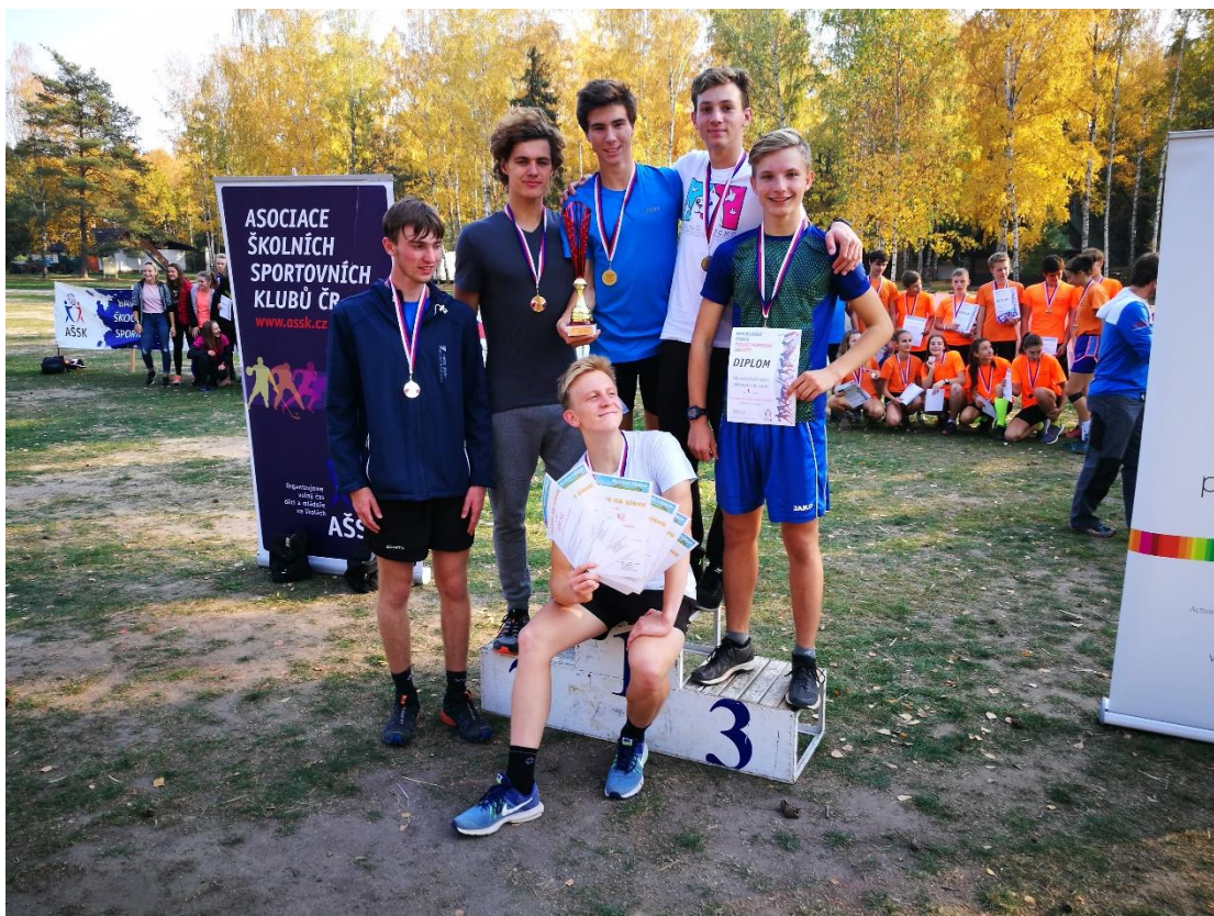
Vítězství v republikovém finále v přespolním běhu