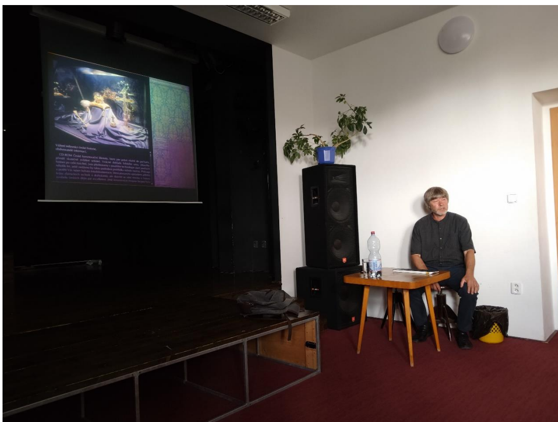
Beseda s Andrejem Šumberou na téma „České korunovační klenoty“