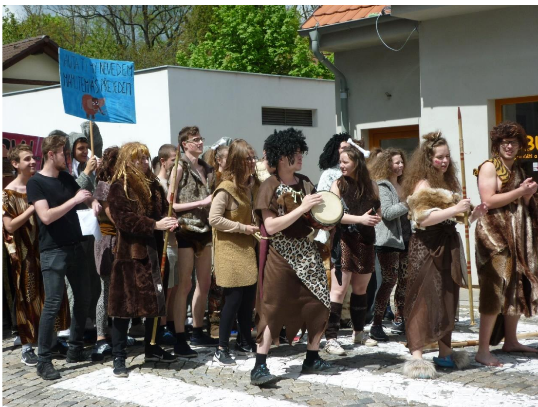
Majáles 2018 v Jindřichově Hradci