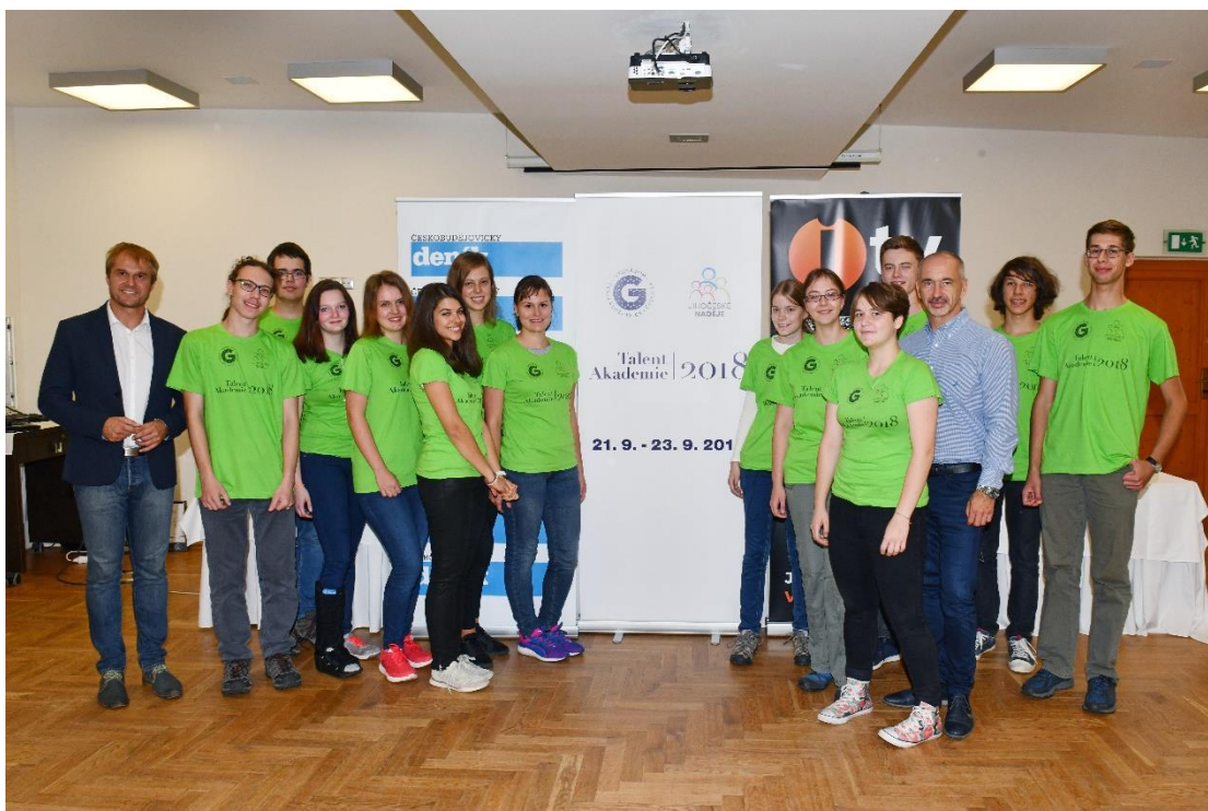
Účastníci 1. ročníku TalentAkademie jihočeských nadějí v Českých Budějovicích