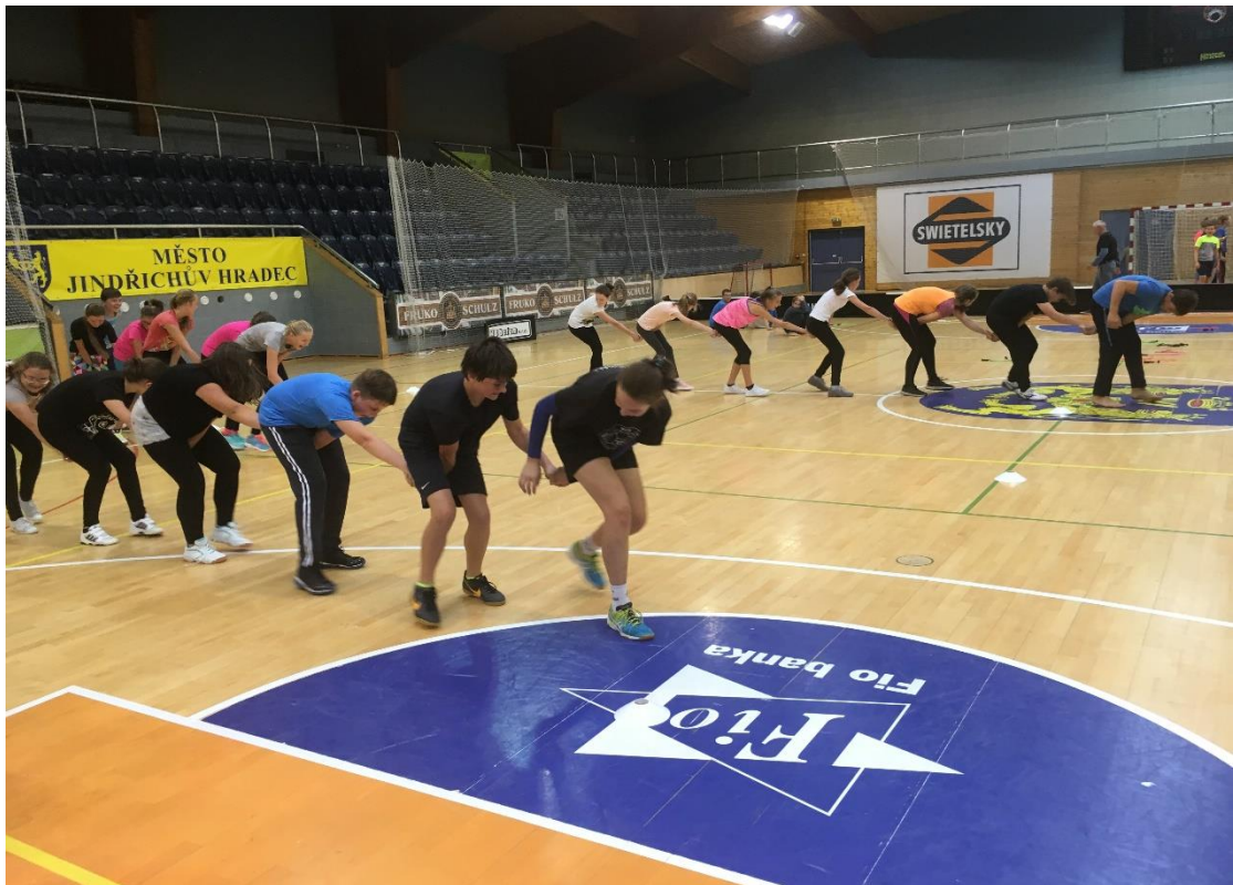
Projektový sportovní den ve sportovní hale v Jindřichově Hradci (září 2018)