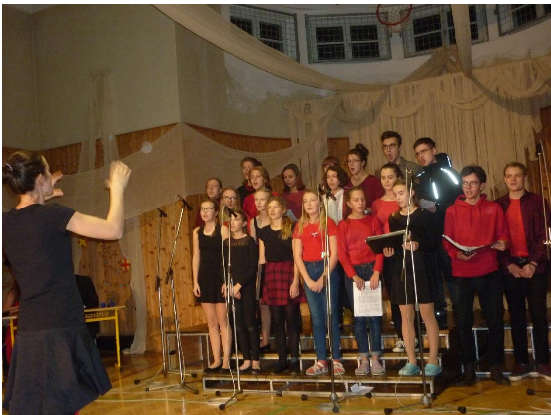
Vánoční besídka 2018