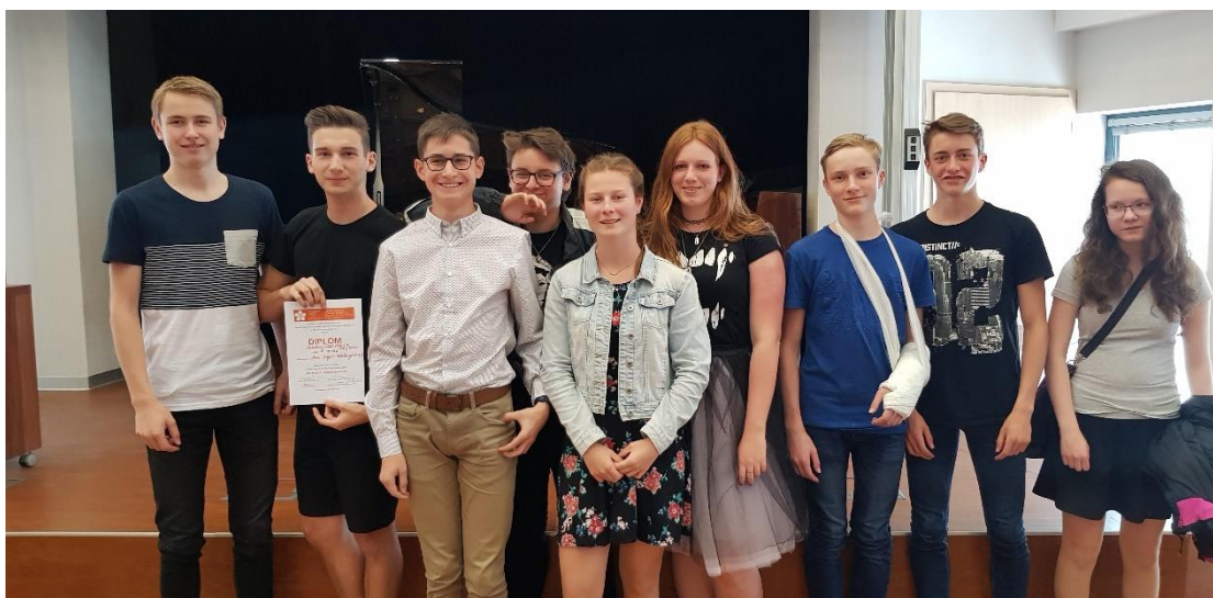
Účastníci krajské kola soutěže Ars poetika v Českých Budějovicích