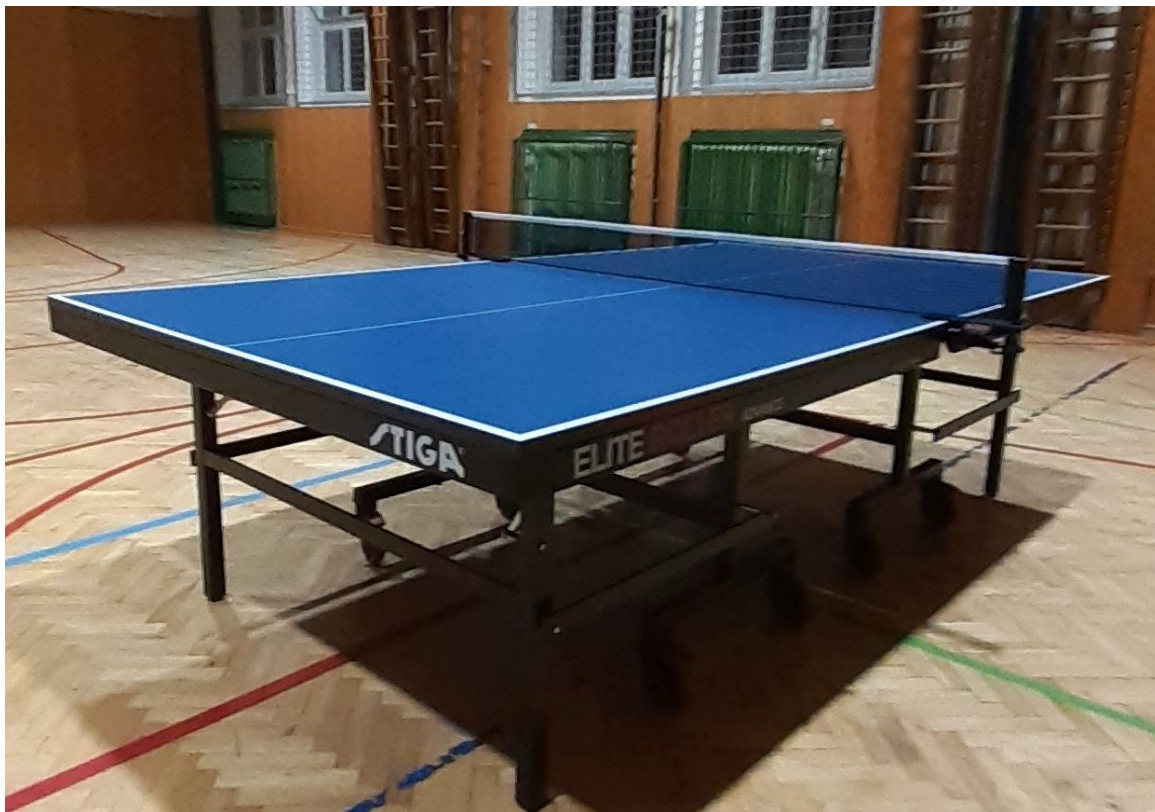
Stůl na stolní tenis do tělocvičny, 2021