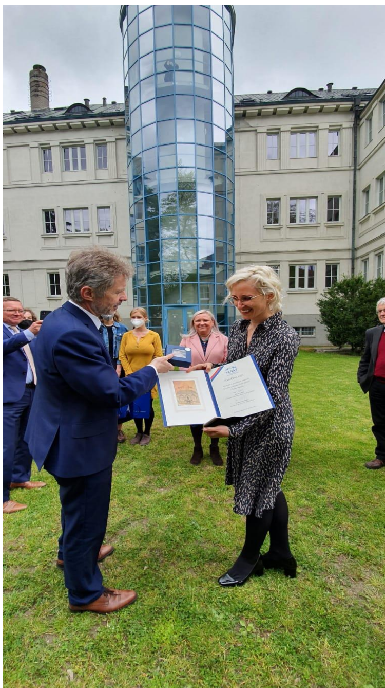
Gymnázium Vítězslava Nováka, DofE, první senátní strom v ČR, 2021