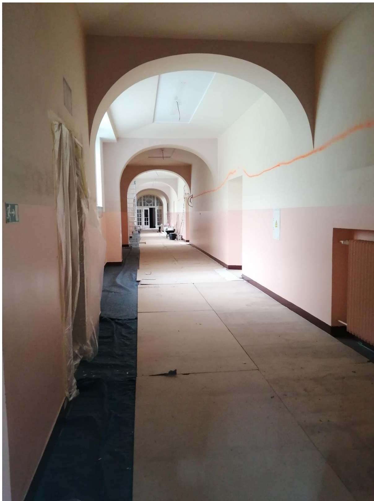
Rekonstrukce elektroinstalace ve 2. a 3. nadzemním podlaží, červenec-srpen 2021