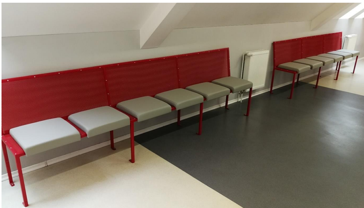
Úprava sezení na chodbě ve 4. patře, 2021