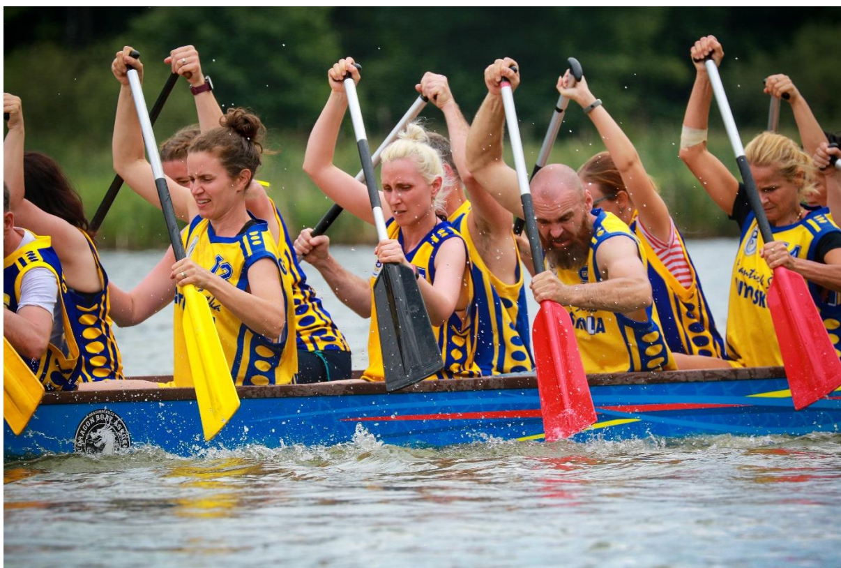
Dračí loď, 2021