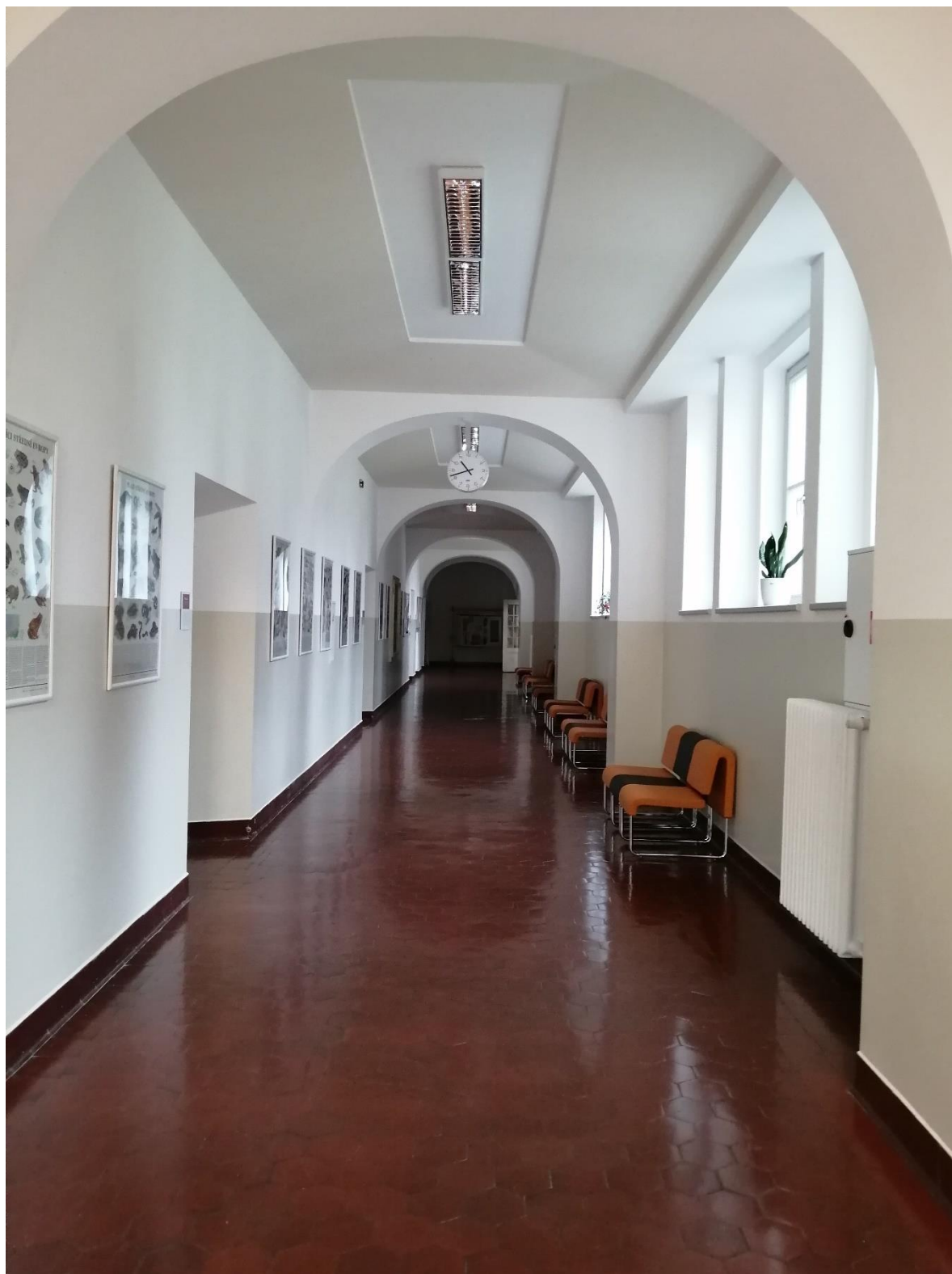
Renovace chodby 1. patro, nové sezení pro žáky, 2021