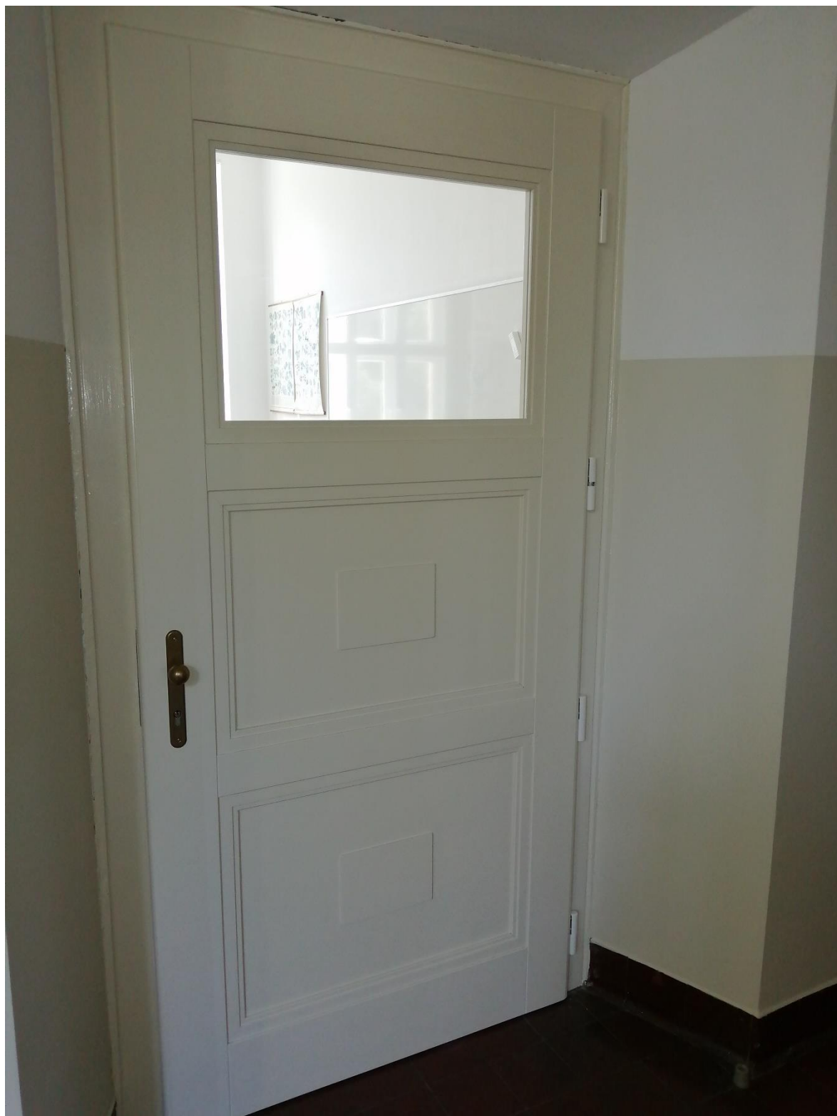
Renovace dveří do učeben v 1. patře, léto 2021