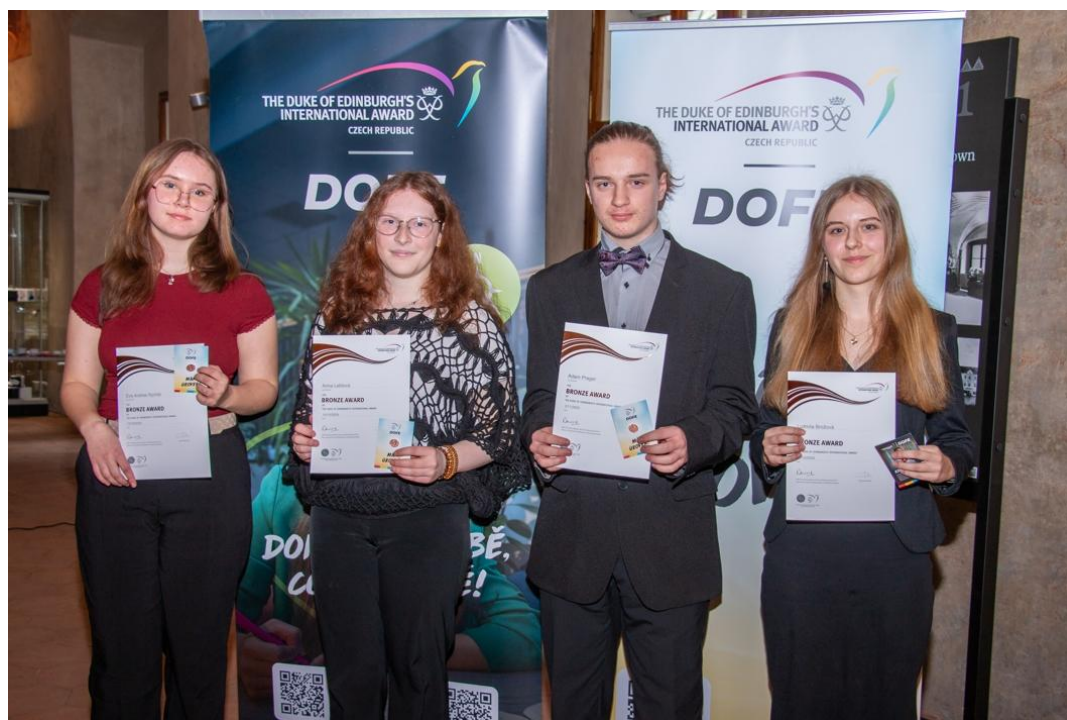
Bronzovo-stříbrná ceremonie DofE, únor 2025