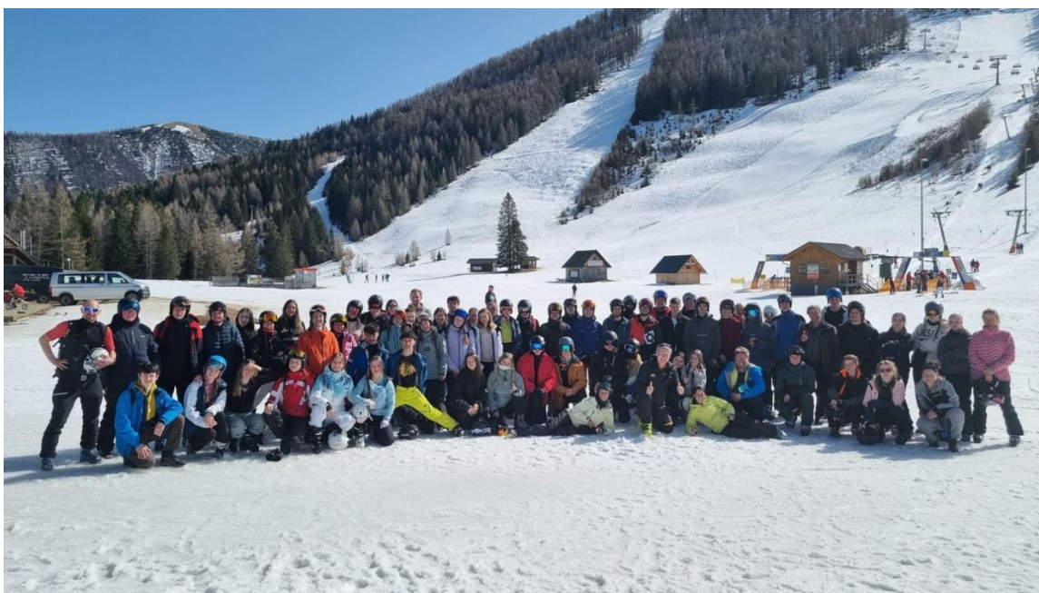
Lyžařský kurz - Hinterstoder, březen 2025