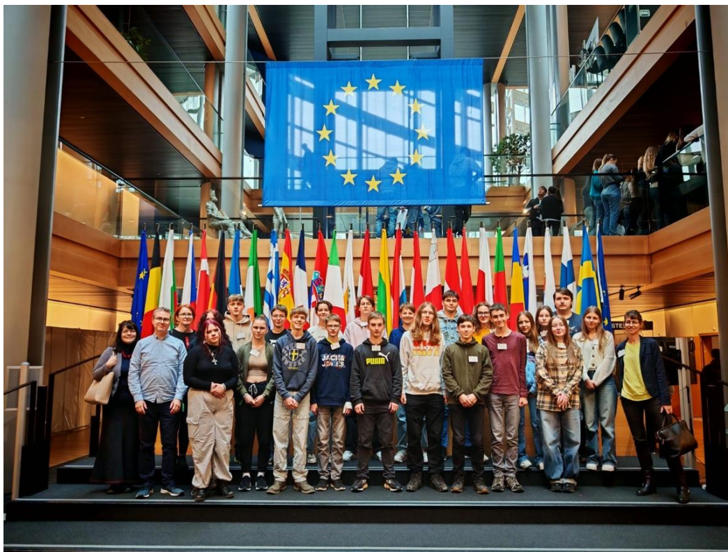
Neckargemünd, březen 2025