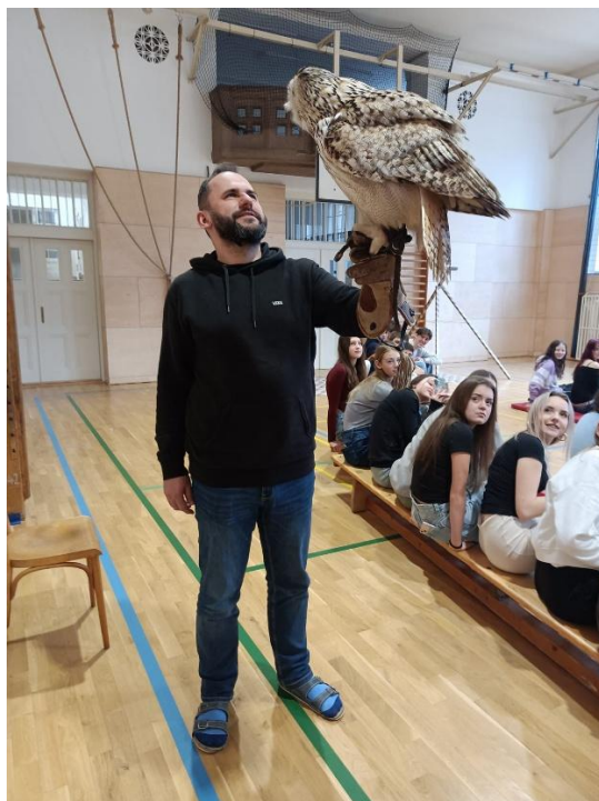
Ukázka dravců a sov, leden 2025