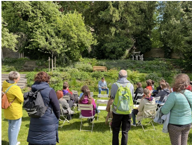
Autorské čtení, květen 2025