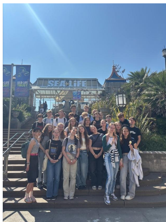
Zájezd do Velké Británie, červen 2025