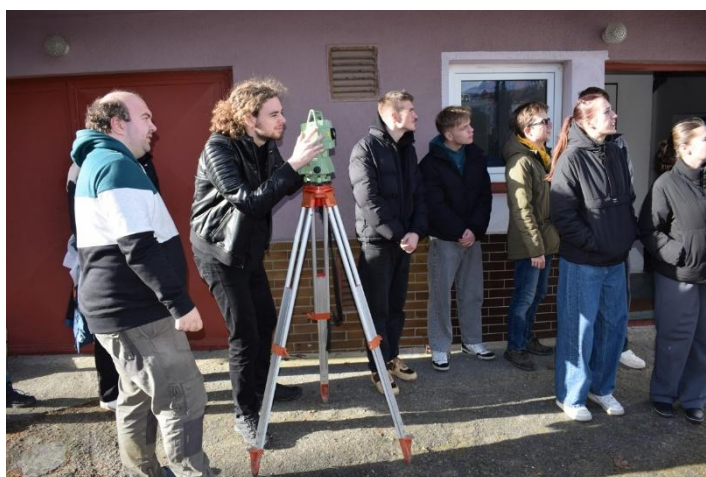
Exkurze na téma geodézie a kartografie, leden 2025