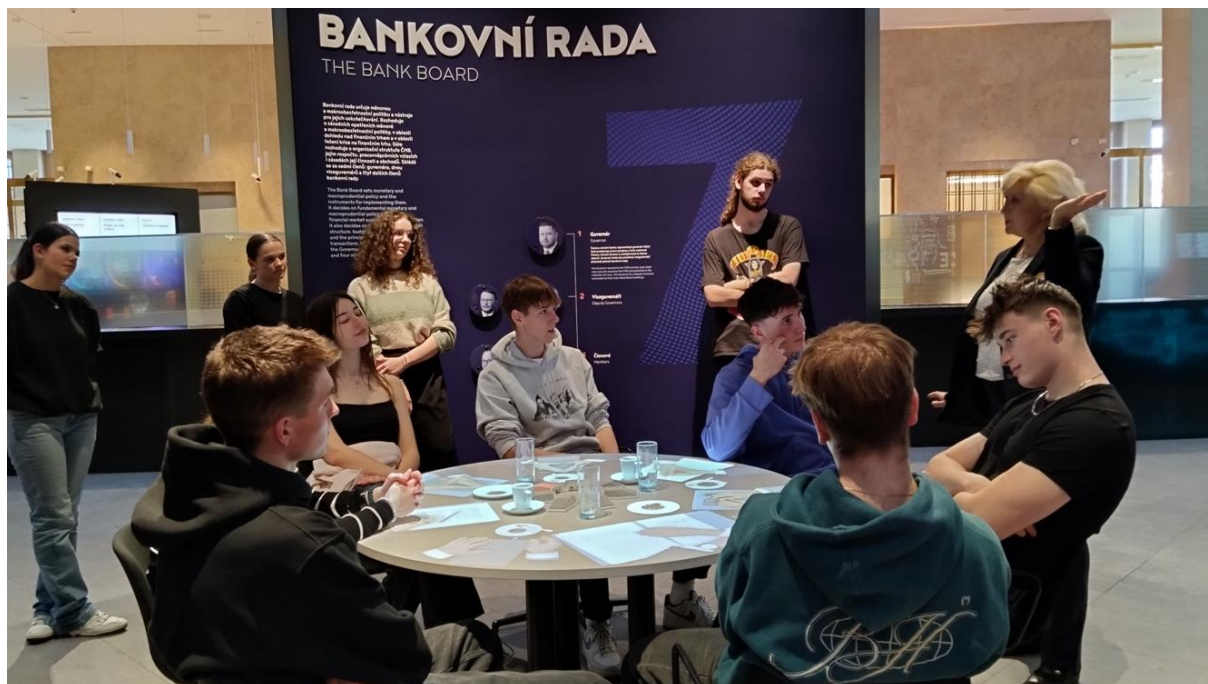
Exkurze do ČNB, březen 2025